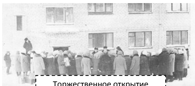
Торжественное открытие общежития

В 1972 году новое здание общежития (на 260 мест) было открыто.