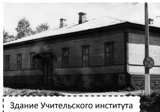
Здание Учительского института в годы Великой отечественной войны

С началом Великой отечественной войны в 1941 году здание училища (тогда учебное заведение имело статус Учительского института) было освобождено под нужды госпиталя. В классных комнатах разместились операционные, палаты для выздоравливающих.