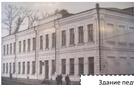
Здание педучилища на ул. 20 лет Победы

Торжественное открытие Соликамской женской гимназии состоялось 25 октября 1915 года.