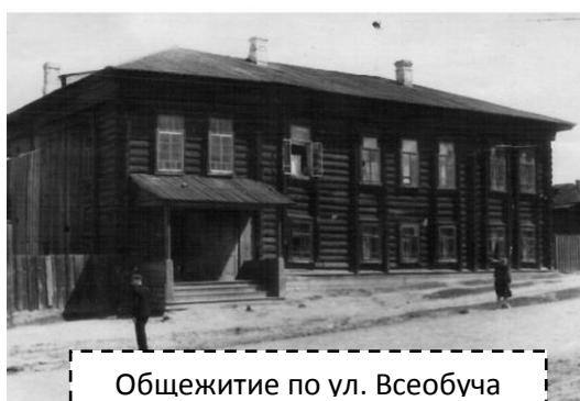
Общежитие по ул. Всеобуча

Для иногородних студентов существовало общежитие. По началу общежитие было неблагоустроенным. Вместе со строительством пристроя к учебному зданию, строилось здание нового общежития по ул. Калийной.