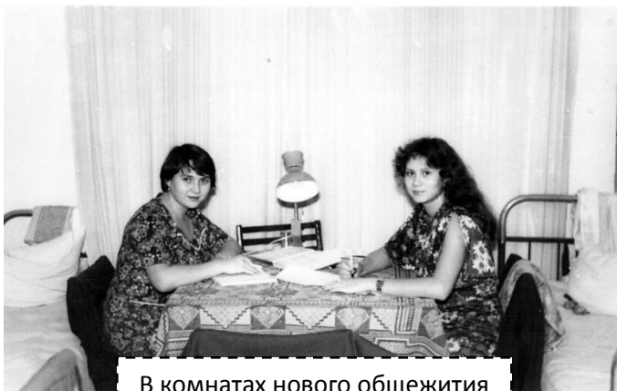
В комнатах нового общежития

После линейки мы пошли в свои комнаты. Только распахнулась дверь, как у комнаты повеяло теплом и свежестью».